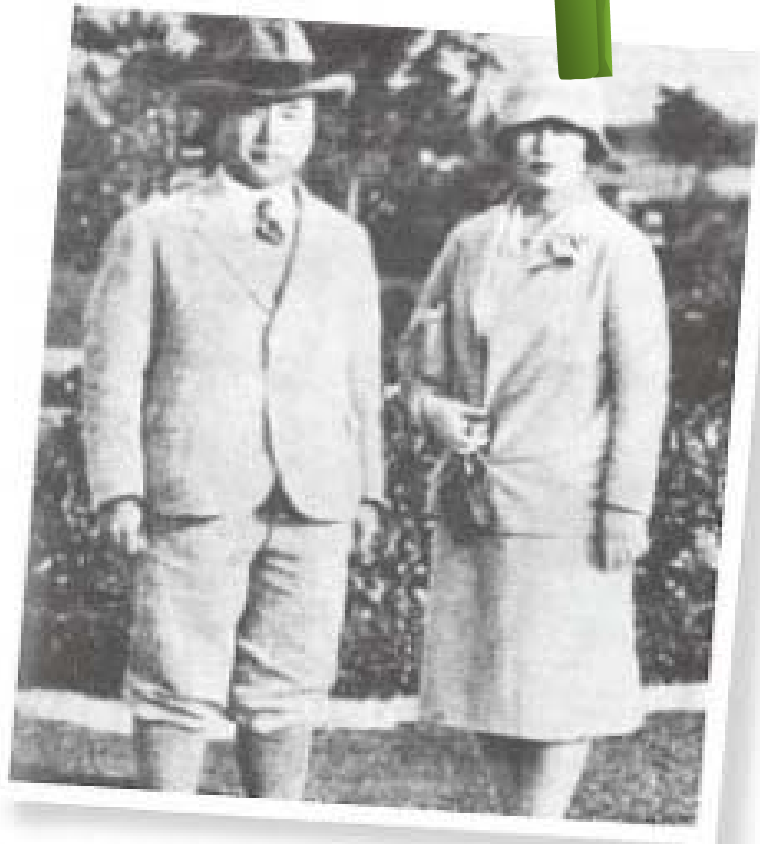
영친왕이 세인트 앤드루스에서 라운드를 한 후 부인 이방자 여사와 찍은 기념사진.