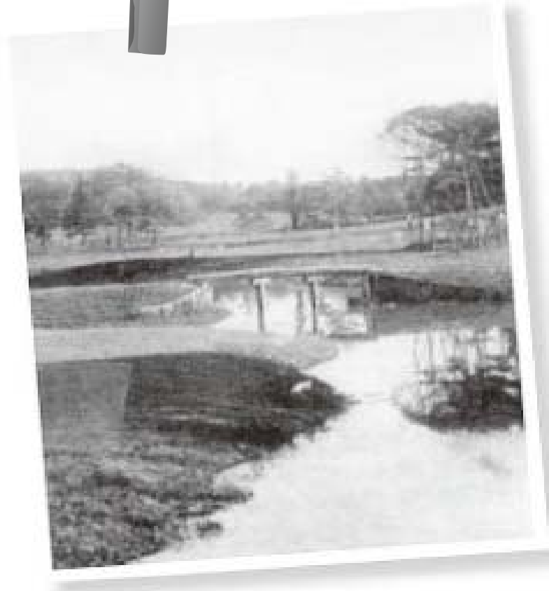
서울 특설의 군자리 코스 18번 홀. 워터 헤저드와 돌다리가 있는 낭만적인 코스였다.