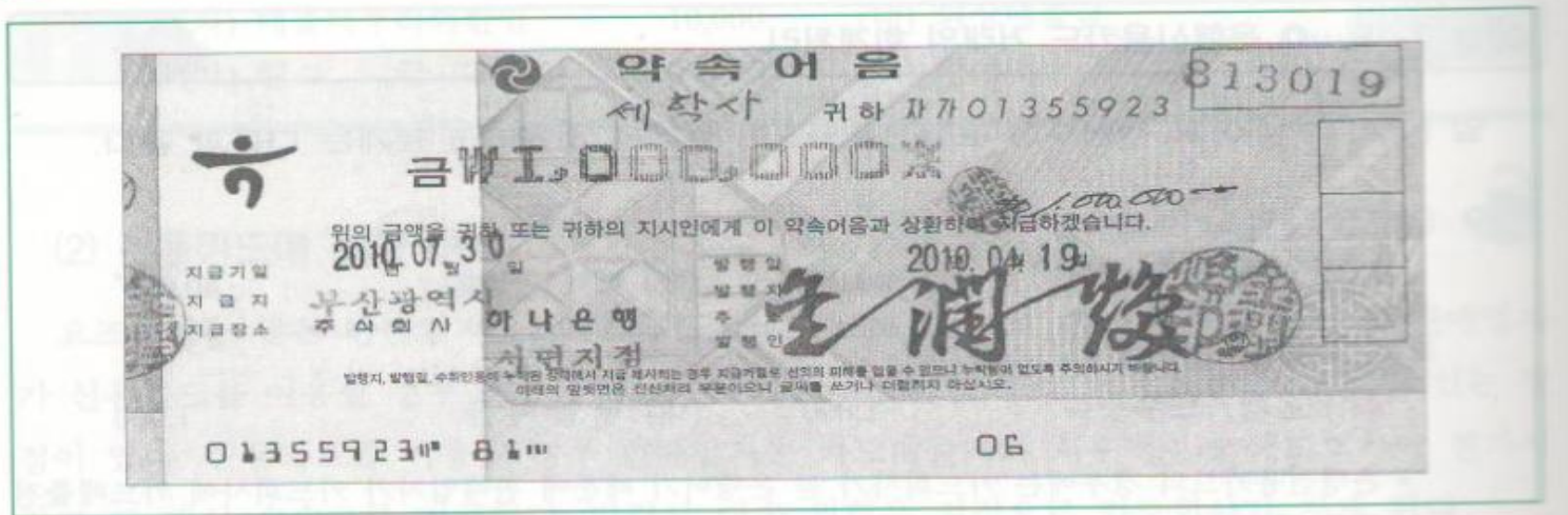
그림 7-1 약속어음(앞면)